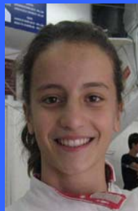
SUB-20 BILBAO HIERRO - ANA 14/12/1994 CAMINO DE SANTIAGO